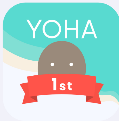
1st Anniversary icon